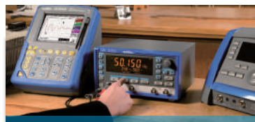
Messgeräte für die Elektronik