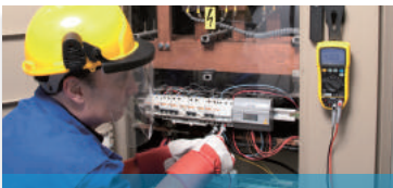
Messung bei Niederspannung