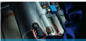
Messung physikalischer Größen