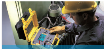
Messung & Prüfung der elektrischen Sicherheit