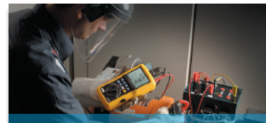
Messung, Erfassung und Analyse elektrischer Leistung & Energie