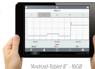
*Android-Tablet 8" - 16GB