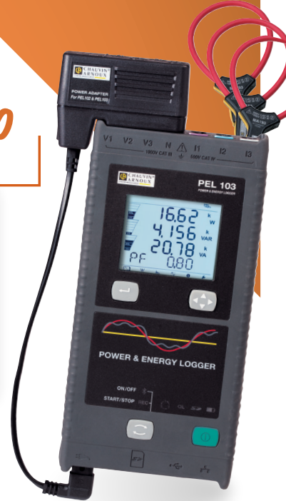
Energierекorder PEL103 + umfangreiches Zubehör