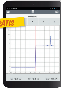
Android-Tablet 8" - 16GB